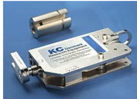
23.050- Nansen 闭锁器