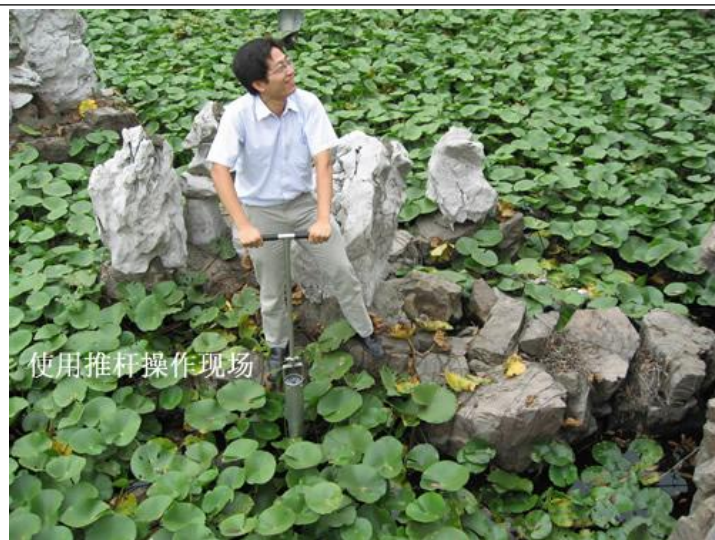
使用推杆操作现场